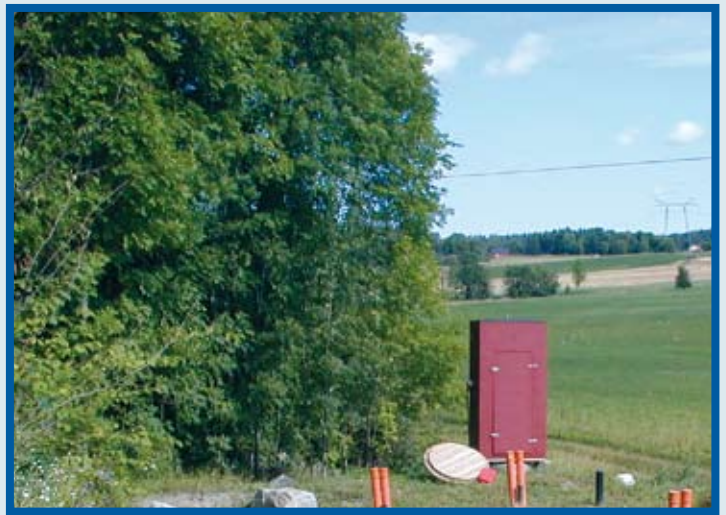
Bilde 2 Pilotanlegget på Talby utenfor Stockholm. Anlegget renser avløpsvann fra Stockholm Vattens kontorbygg ved Bornsjön. Den røde bua inneholder prøvetakingsutstyr for døgn- og ukesblandprøver.