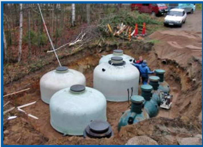
Bilde 1 Fra bygging av kompaktanlegg for to boliger i Kuusankoski, Finland. Bildet viser septiktank, to forfiltertanker til venstre og to tanker for fosforfjerning med Filtralite®P midt på bildet. Forfilterne er bygget med resirkulering.